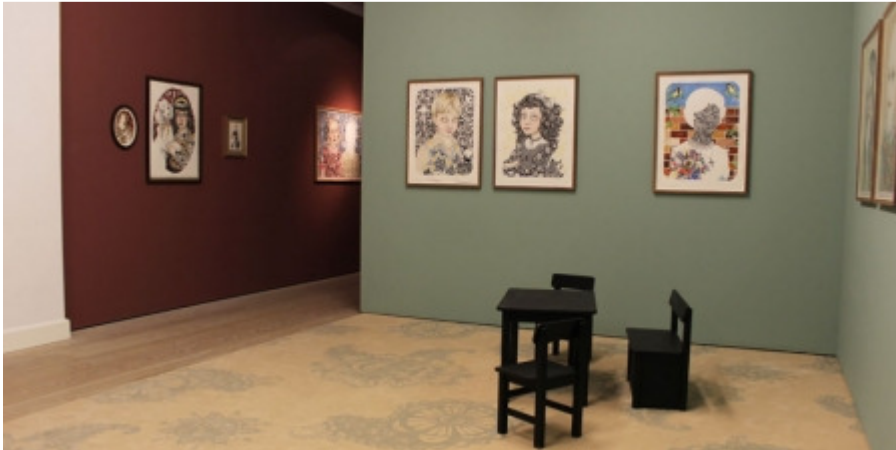
Installationsview, Julie Nord: Just Like Home.